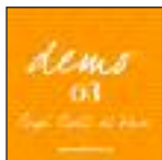
Illustrazione legge finanziaria 2011.